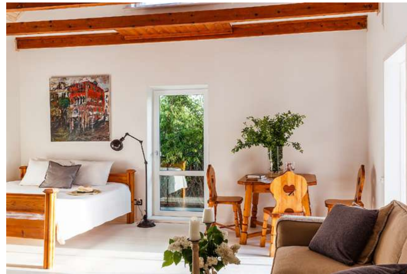
Белый номер — самый большой, площадью 50 квадратных метров и к тому же двухэтажный. Там легко разместится компания из семерых человек.