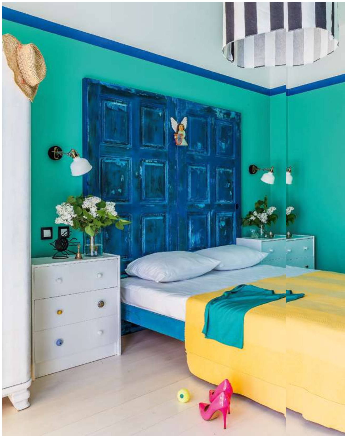
Двухкомнатный Зеленый номер рассчитан на четырех человек. В тумбочке IKEA заменили ручки, а «сталинский» шкаф с зеркалом вывезли из московской квартиры и перекрасили.